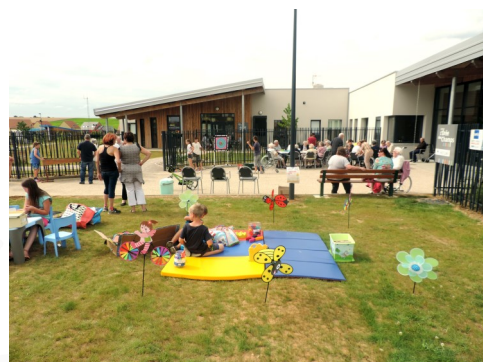
La Caravane d'été s'installe dans les quartiers en juillet-août et propose aux habitants de se retrouver autour de ses activités. L'été dernier, elle s'est notamment installée sur le parvis du nouvel Ehpad, permettant à toutes les générations de se rencontrer.